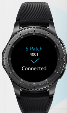
Watch Gateway App