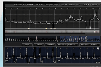
Cardio Web Portal