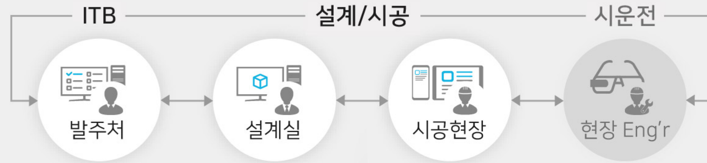
① 웹만으로 다자간 원격 3D 설계 리뷰

Nexplant 3D eXcellence 기반의 고성능 데이터 변환과 초경량화 기술을 활용하면, 저 사양의 현장 모바일 기기에서, 웹 브라우저만으로 3D 설계도면을 조회하고, Mark-Up /Comment 공유 및 이력 관리를 통해 발주처/해외현장/외주 설계사 간의 실시간 협업 미팅이 가능합니다.